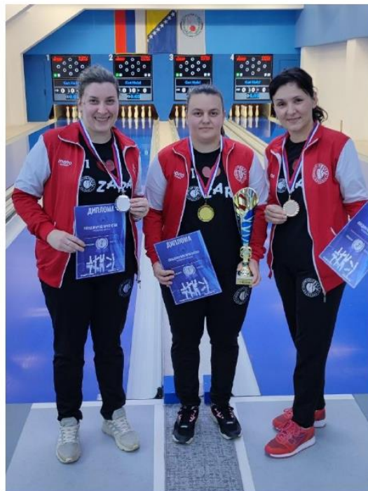
Banjaluka 10.12.2022. - Prijedor 25.12.2022.